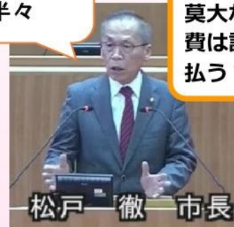
松戸 徹 市長